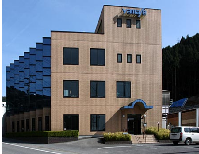
本社・技術営業部